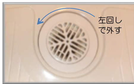
浴室排水トラップ