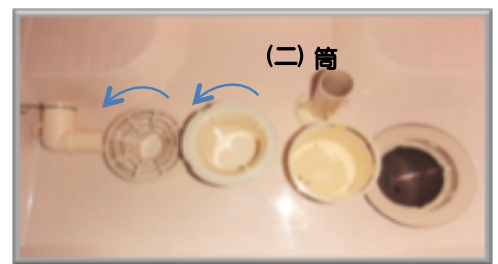
(イ) 排水接続ホース (□) 目皿 (ハ) 封水筒 (ホ) カップ 内部排水トラップ